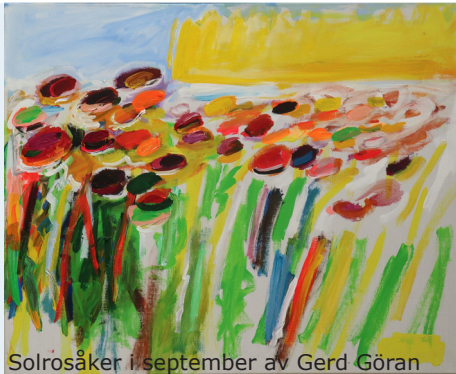
Solrosåker i september av Gerd Görän

Tunnetun ruotsalaisen taidemaalarin ja tekstiilitaiteilijan Gerd Göränin töitä on näytteillä Hälleforsin kirjastossa. 14. toukokuuta kaikki ovat tervetulleita Monimuotoisuusnäyttelyn avajaisiin. Gerdin taidetta on nähtävänä 28. toukokuuta asti. Lisätietoja on osoitteessa hellefors.se/bibliotek .